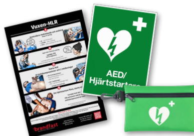
Handlingsplan, skylt och first responder kit ingår alltid